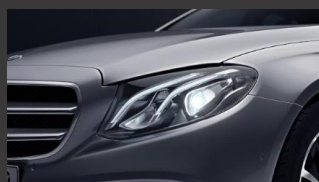
High-performance LED-koplampen (632)