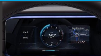
Widescreen cockpit (464)