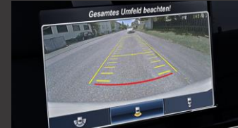
Parkeerpakket inclusief achteruitrijcamera (P44)