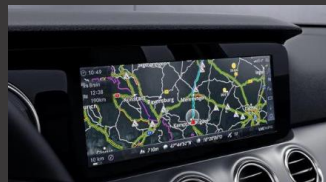
Mercedes-Benz navigatie (357)