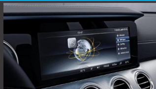
Mediadisplay 12,3 inch (868)