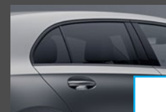
Warmtewerend donkergelakt glas (840) € 363

Connectiviteitspakket smartphone (PBI) € 0