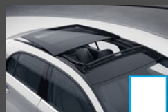
Panormaschuifdak (413) € 1.125