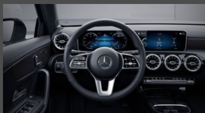
Widescreen cockpit (458)