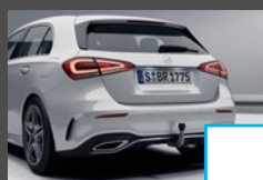
Trekhaak (550) € 968