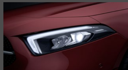
High-performance led-koplampen (632)